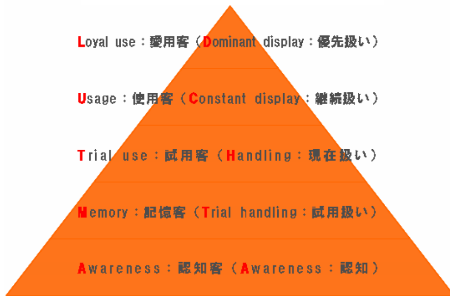
図表 1 「AMTUL の法則」を用いた顧客進化モデル

コンサル S : この会社では「固定客」、つまりピラミッドの頂点である「愛用客」を増やさなければならないという戦略課題を抱えています。